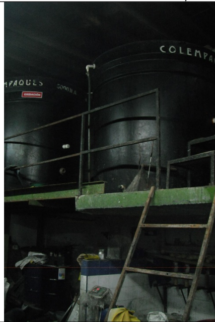
Foto No. 3 y 4. Sistema de tratamiento de aguas residuales producto del proceso