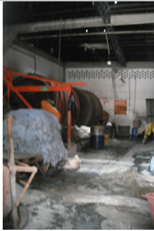
Foto No. 2 Proceso de curtación de pieles