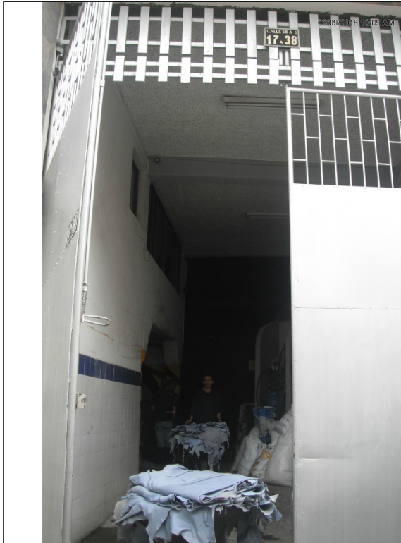
Foto No. 1 Fachada del establecimiento